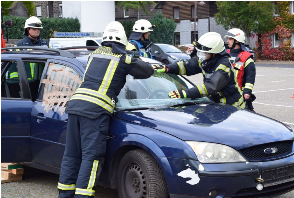
Bild 1, Glasmanagement bei der Personenrettung.