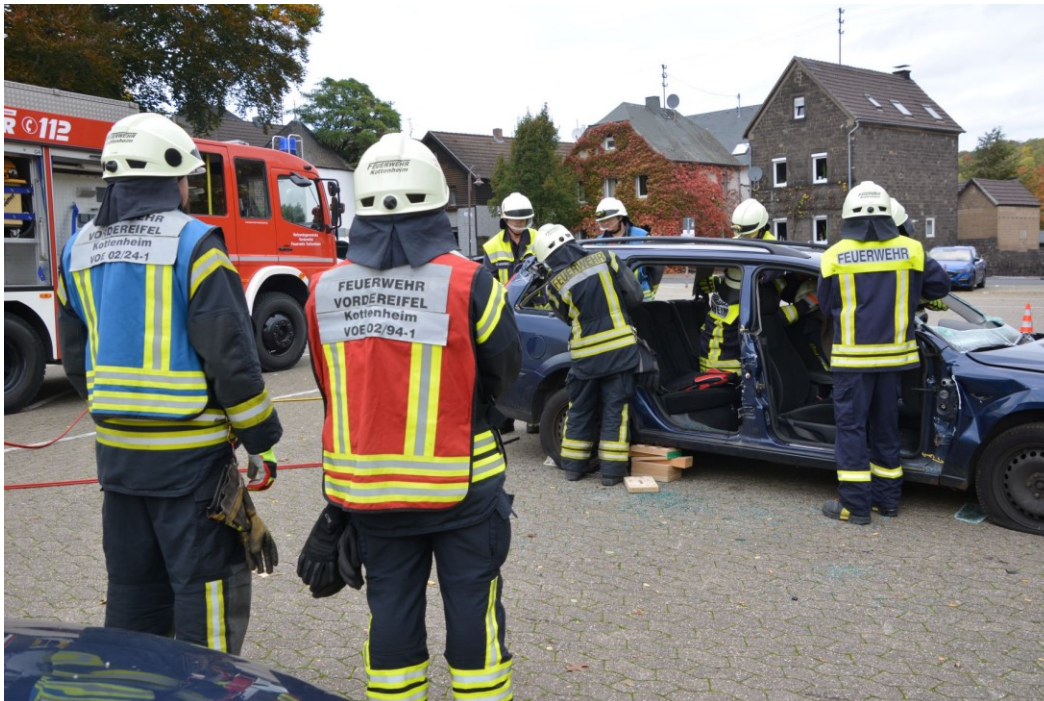
Bild 2 Rettung der verunfallten Person mit Schere und Spreizer.

Deine Heimat. Deine FEUERWEHR Komm, mach mit!